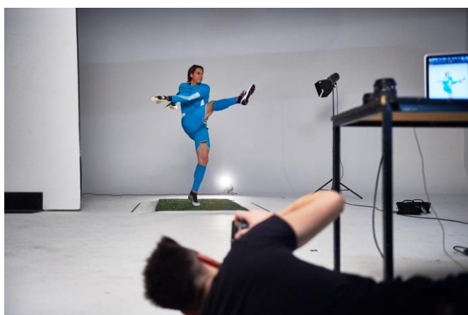
Links: das Making-of

Für Panasonic war der Schweizer Nationaltorhüter bereits im April in Düsseldorf vor der Kamera, um die brandneue Werbekampagne zu fotografieren. Wir haben den Sympathieträger Backstage begleitet und Impressionen des Shootings aufgenommen.